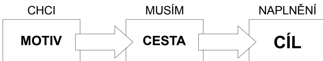
Obrázek č. 3 Model motivace-cesta-cíl.

Každé jednání má svůj účel. Motivy a potřeby usměrňují naše jednání a dávají mu energii. Motivace je tedy jakýmsi motorem konání. Motiv nepůsobí vždy jenom jeden, ale je jich současně celá řada a vzájemně se ovlivňují, ovšem jeden z nich může být hlavní a ten nakonec vede k zaměření a výběru příslušného modelu chování a jednání. Obecně si ukažme na modelu, jak takové chování vypadá. Jedinec vidí ve velkém množství možností objekt, který upoutá jeho pozornost. Po chvíli pozorování je objektem přitažen, vtažen, uchvácen natolik, že vnitřními silami zpracovává čím dále tím více různé „pohledy“ na objekt. Až v jistou chvíli ví, že CHCE objektu a v tuto chvíli již cíle dosáhnout.